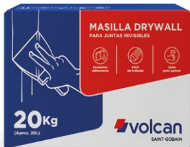
CAJA 20 KG

Producto en pasta listo para usar, elaborado con aditivos especiales que otorgan máxima adherencia y fino acabado. Especialmente indicada para la realización de juntas invisibles entre placas de yeso Volcán (drywall) y reparación de tabiques y cielos rasos.