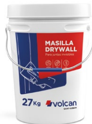
BALDE 27 KG