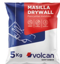
BOLSA 5 KG